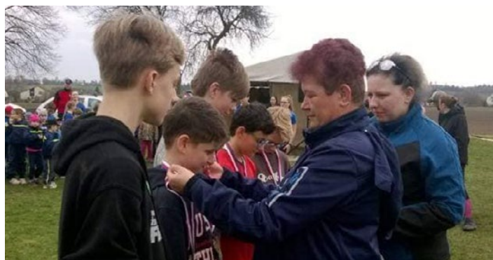
Zlato starších chlapců - Rožnov