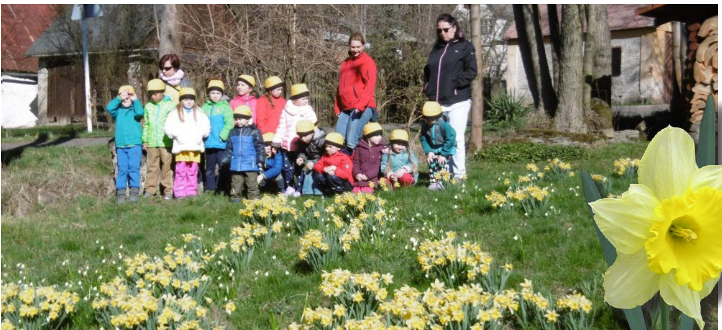
Vycházka za jarem