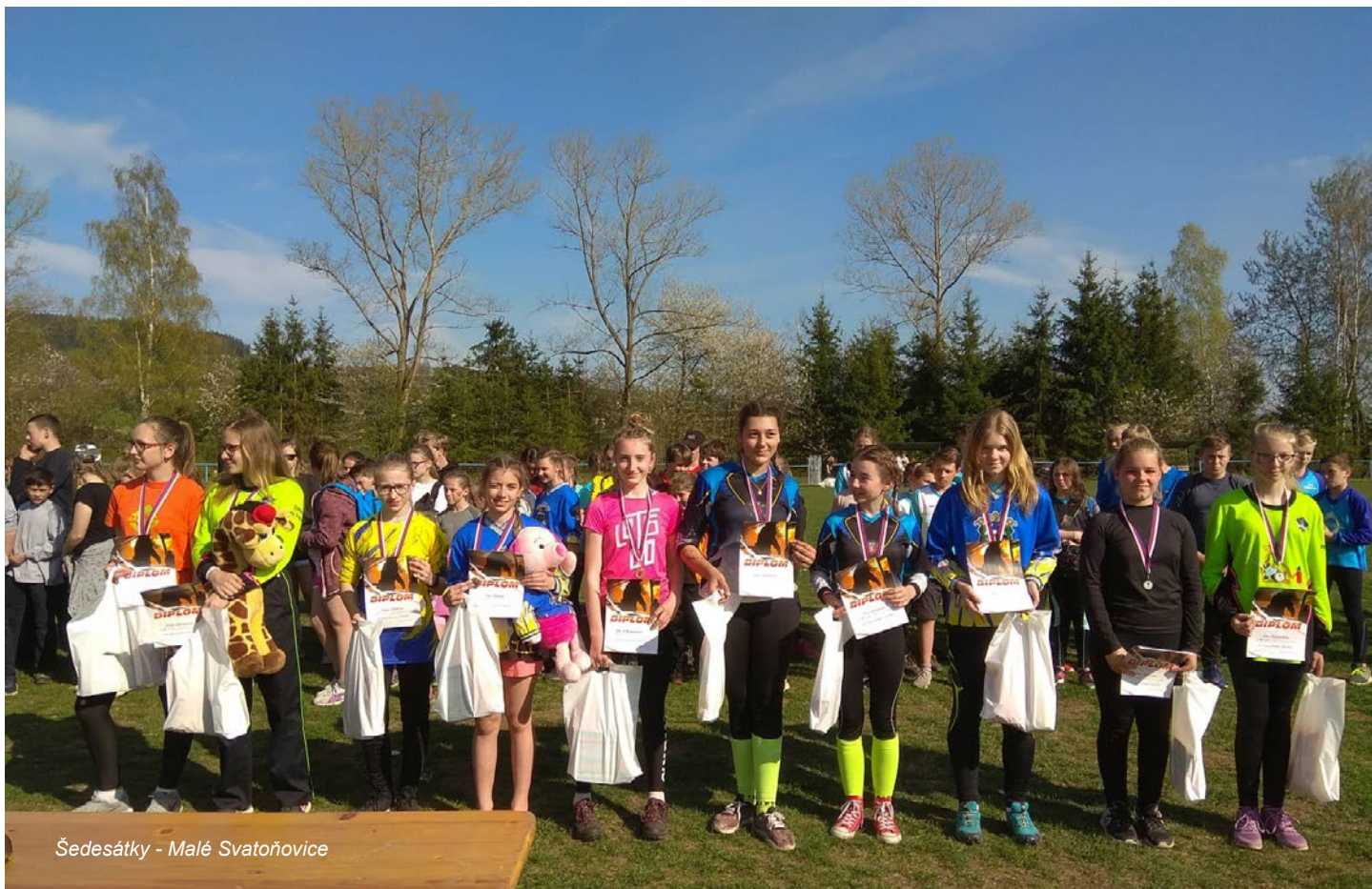
Šedesátky - Malé Svatoňovice

V dubnu pokračujeme v závodním tempu, kdy nemáme volný ani jeden víkend. Připravujeme se na okresní kolo nejlepším možným způsobem, a to právě absolvováním co nejvíce závodů.