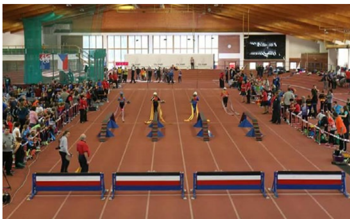
Šedesátkování - Jablonec nad Nisou