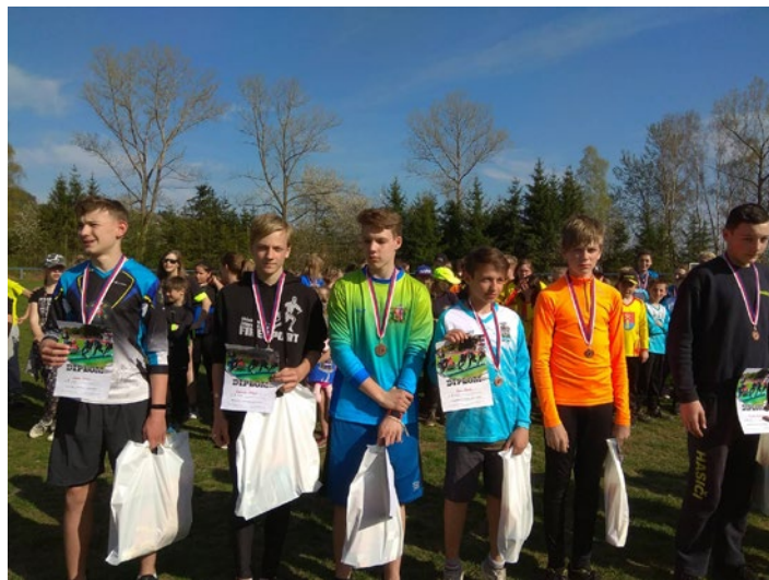
Šedesátky - Malé Svatoňovice

Na stole je pro závodníka připraveno 5 provazů, co provaz, to jeden uzel. Začíná se zkracovačkou, jediný z uzlů se váže v ruce a není vázán na hadici. Následuje lodní uzel, plochá spojka, provazy na tyto uzle jsou volné, ale uzel musí být uvázán na hadici. Další je tesařský uzel, provaz je na jednom konci pevně přidělán ke stolu, musí být uvázán jen jedním volným koncem. A poslední je nejsložitější, úvaz na proudnici. Tady většinou bývá nejčastěji chyba, která znamená neplatný pokus. Naše děti v Radvanicích dosáhly časů v rozmezí 26-35 s.