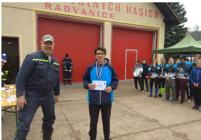
ZPV další zlato - Radvanice

Narazili jsme na další disciplínu našeho sportu, tentokrát takovou asi ze všech disciplín nejméně sportovní :-)) - uzlovku.