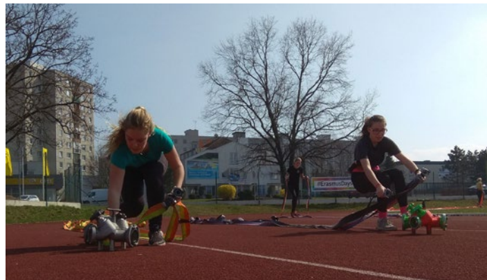
Tréninkový kemp - Pardubice

a seběhem (každý 2 m). Už na seběhu začínají děti v běhu spojovat hadice k sobě, v ideálním případě k rozdělovači, který je umístěn 43 m od startu, přibíhají se spojenými středy a v pravé ruce s připravenou koncovkou, kterou „bouchnou“ na rozdělovač, odloží spojené středy, pak už jen vytáhnout proudnici, která je za páskem, napojit na poslední spojku a běžet do cíle.