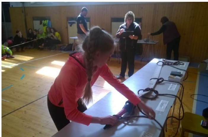
Uzlovka - Radvanice

Na stupně vítězů se nám tady ještě nikdy nepodařilo vystoupat, ale zkušenosti sbíráme a zúčastňujeme v našem okresním přeborníkovi šedesátkování. Naše výsledky stačí na stupně vítězů u nás v okrese, v obrovské konkurenci halového poháru jsme se k bodovaným pozicím nepřiblížili. Tato soutěž je opravdu o získaných zkušenostech a rozjezdu na začátku sezóny po zimním odpočinku.