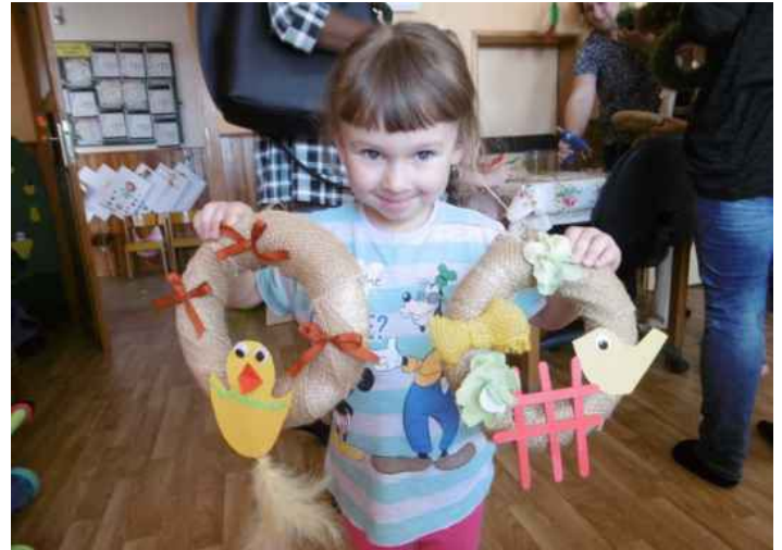
16. 4. Velikonoční tvoření s rodiči, už tradiční akce mateřské školy