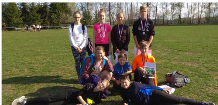
Šedesátky - Malé Svatoňovice